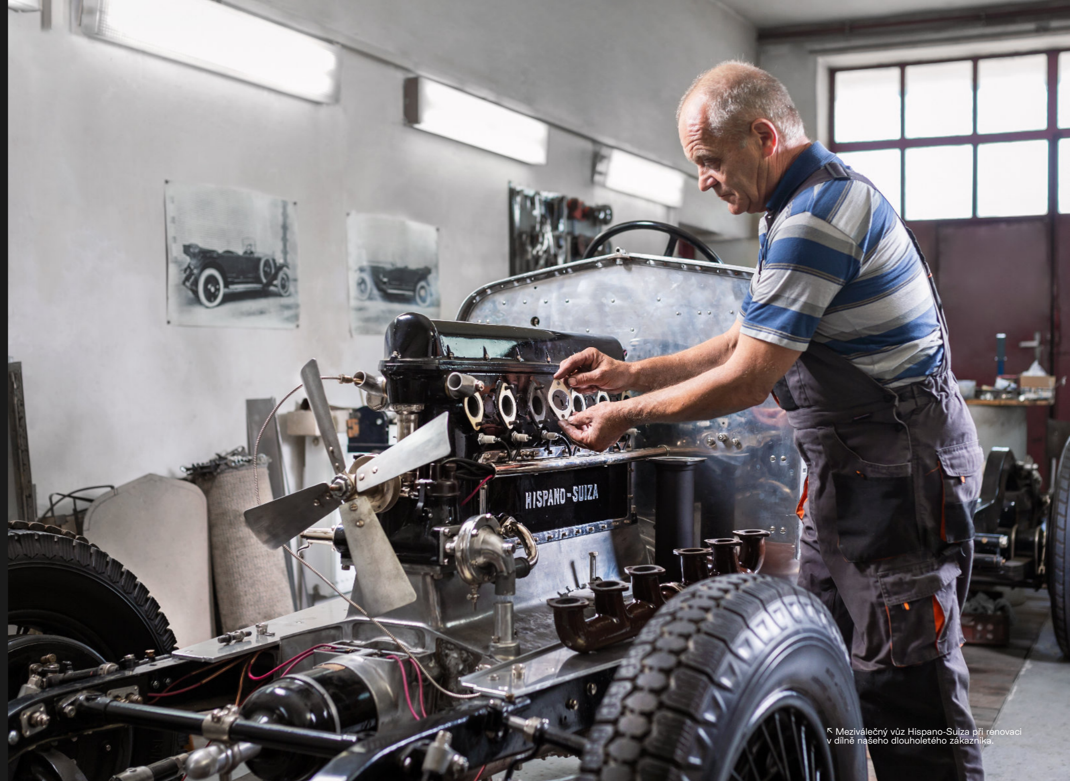
↳ Meziválečný vůz Hispano-Suiza při renovaci v dílně našeho dlouholetého zákazníka.